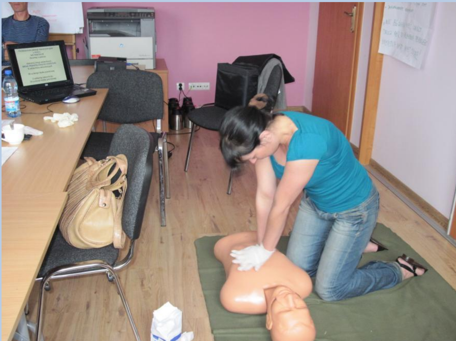
Kurs - pierwsza pomoc przedlekarska