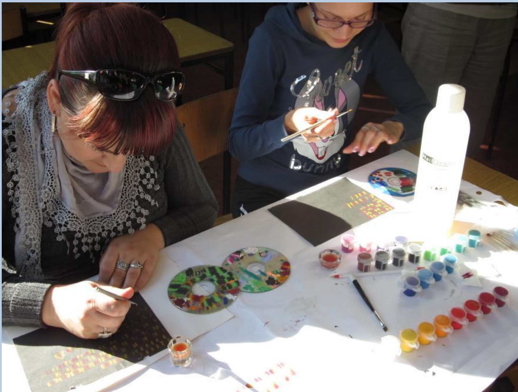
Kurs – kosmetyczny