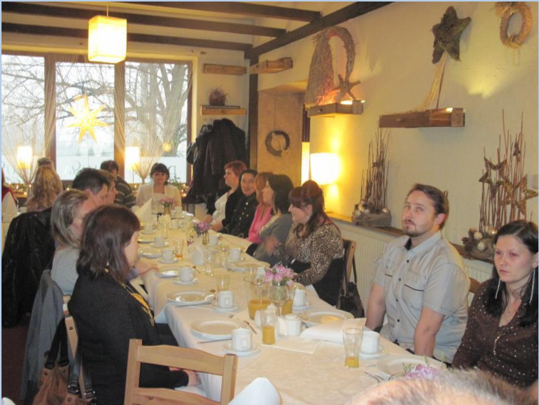
Konferencja podsumowująca projekt