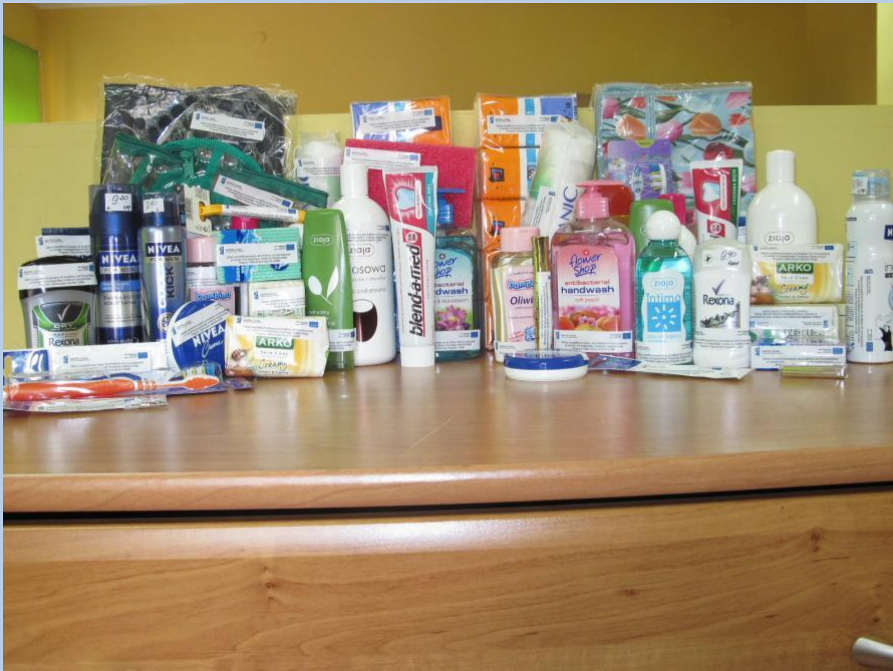
Wyposażenie kosmetyczki na kurs umiejętności praktycznych