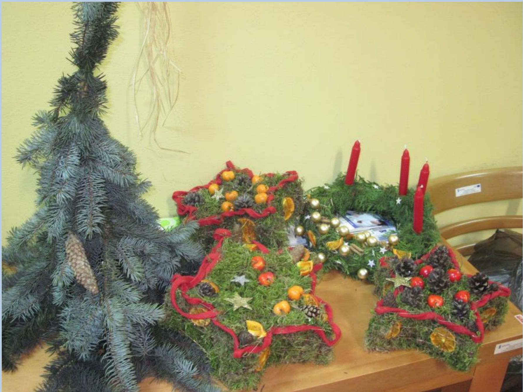
Wykonano na kursie bukieciarstwa