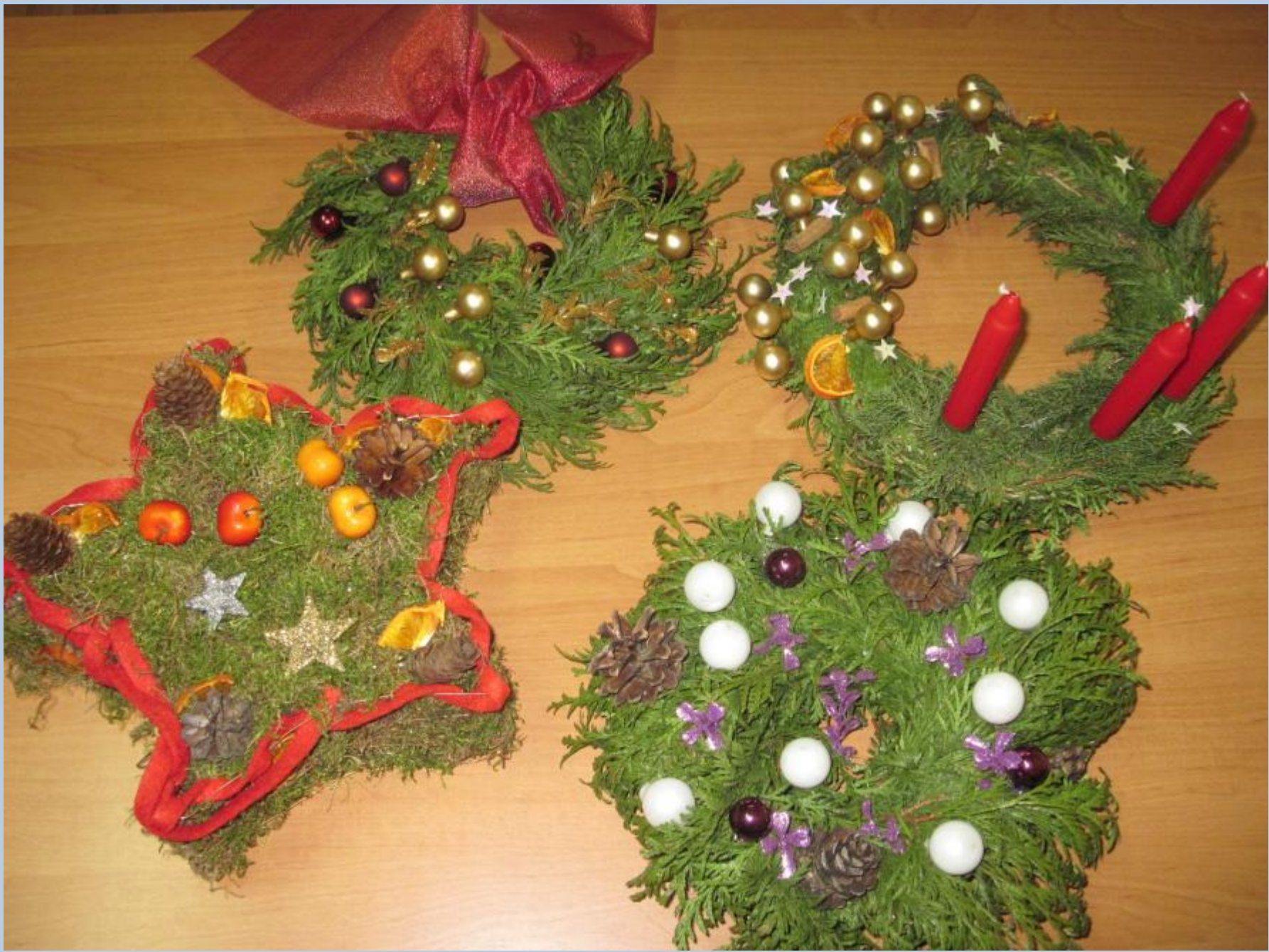
Wykonano na kursie bukieciarstwa