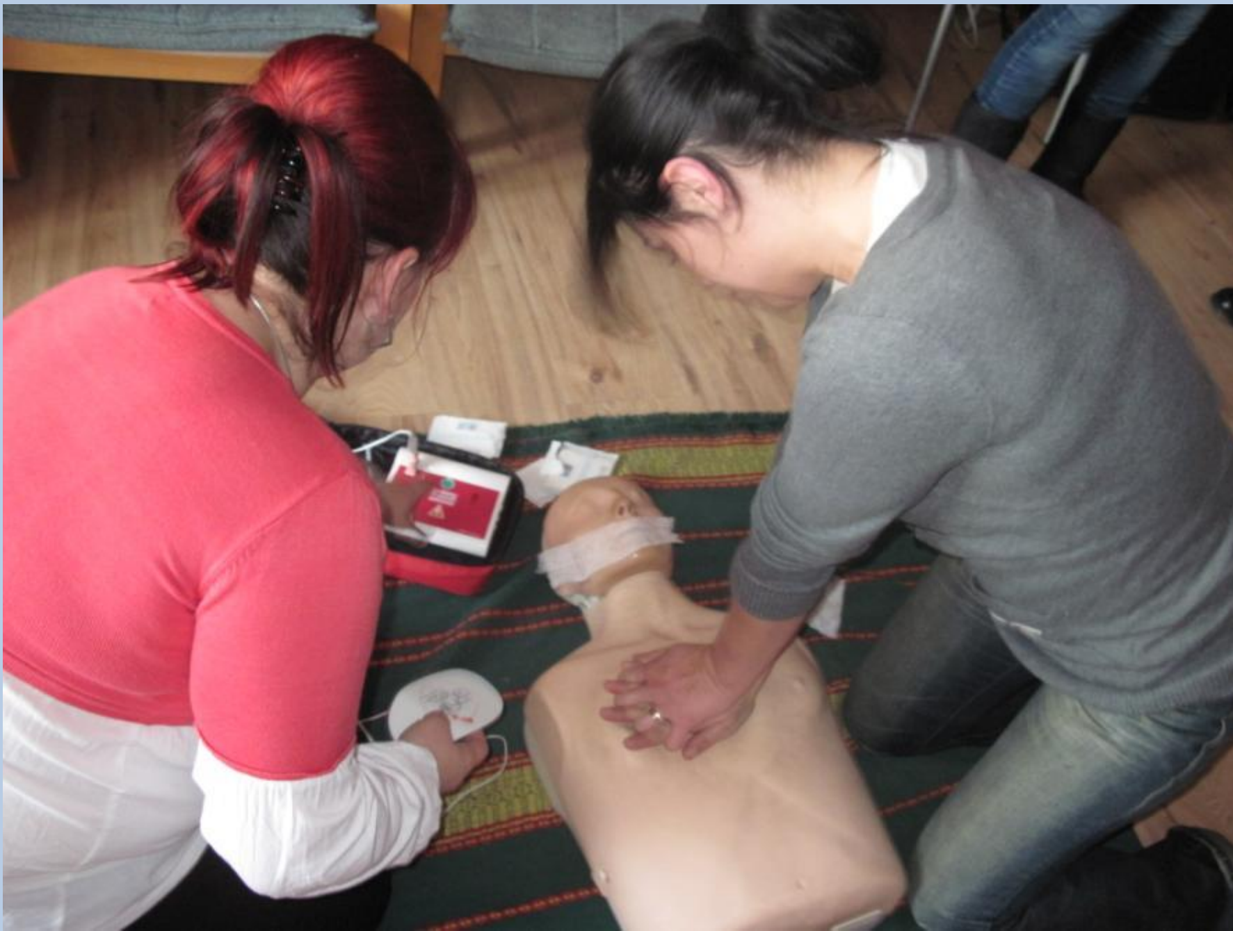
Kurs - pierwsza pomoc przedlekarska